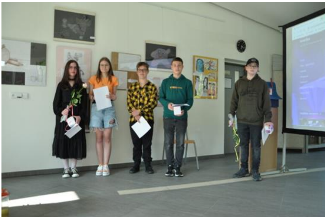
Absolventi výtvarného oboru.