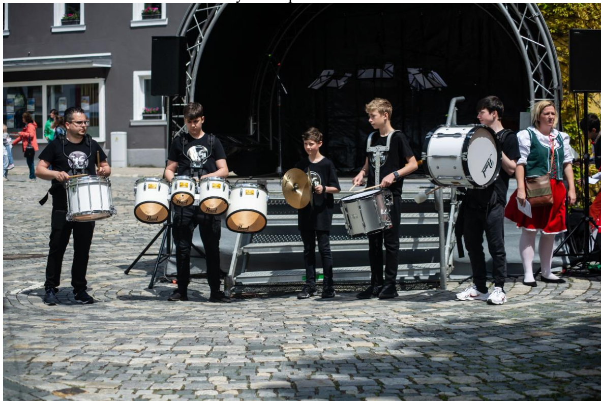
Bicí soubor na Bavorsko- českých dnech přátelství v Selbu.