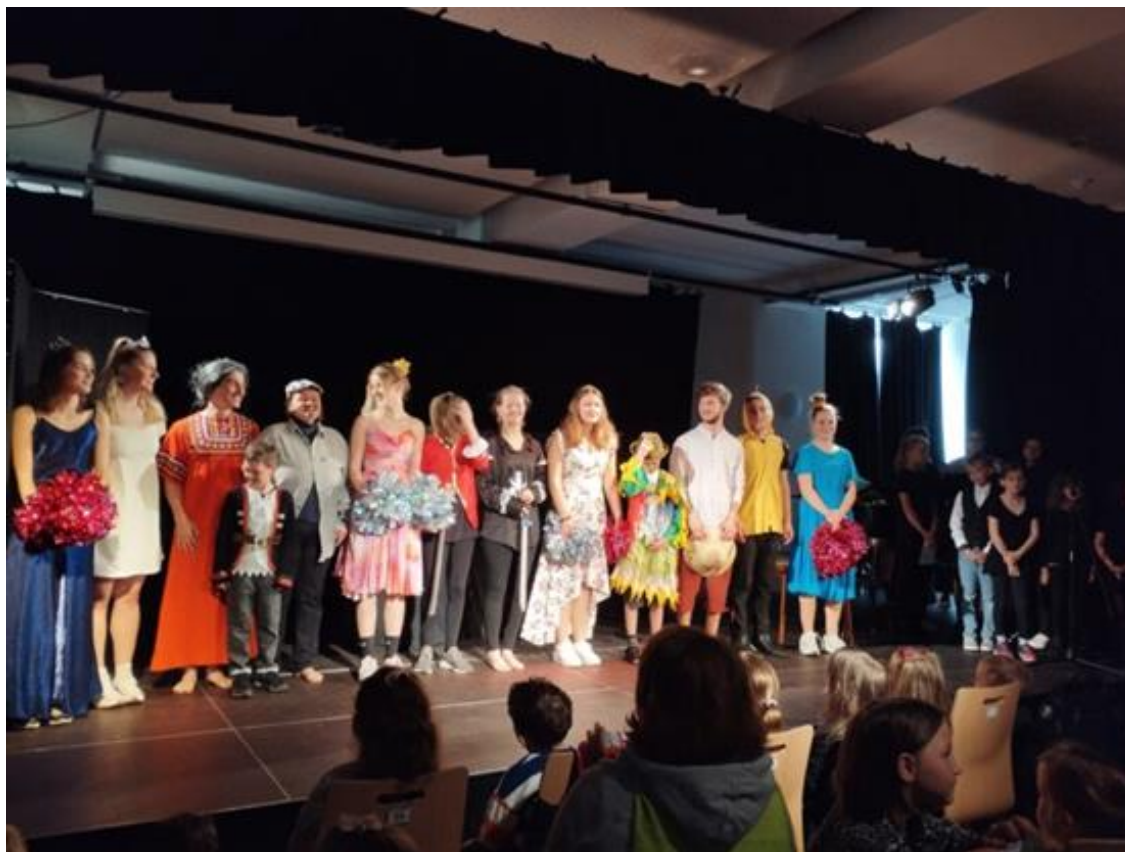
Herci a zpěváci z pohádky O chytrém Honzovi.