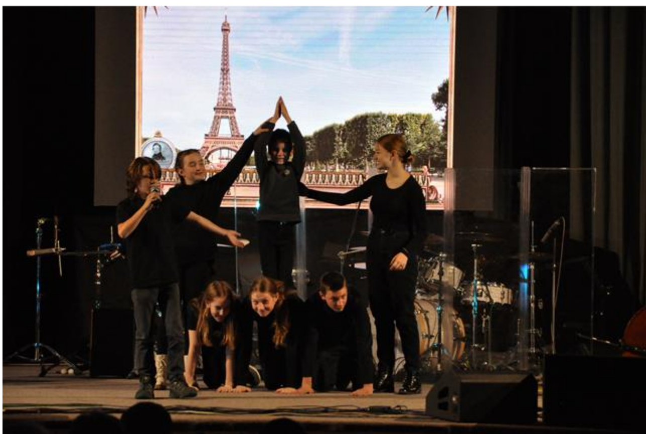
Podzimní projekt celé ZUŠ nazvaný „Cesta kolem světa“ (nahore zpěváci a kytaristé, dole divadelní soubor Hranický dram.).