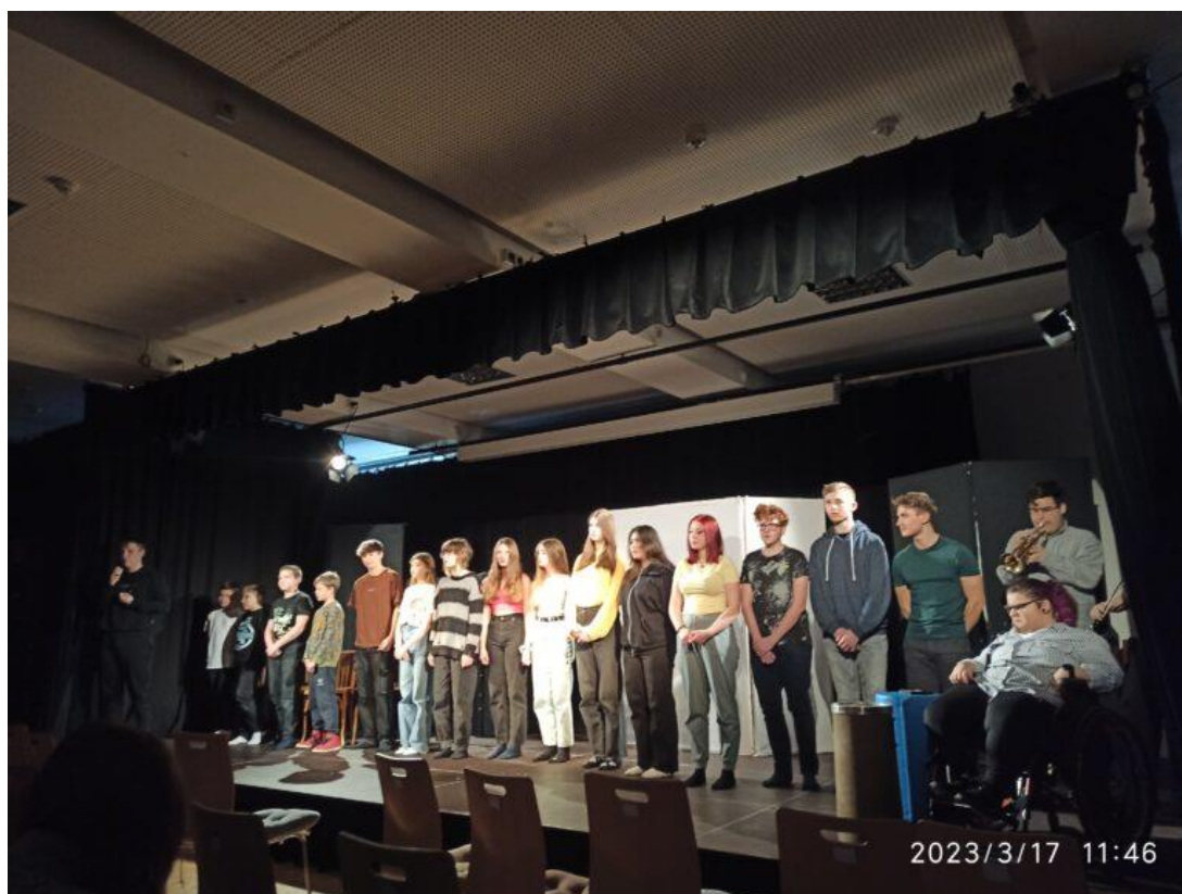
Divadelní soubory Jakože a Nakdyby s představením Mlha je spadlý mrak.