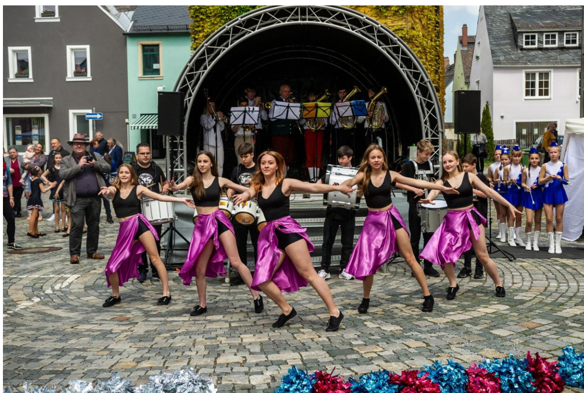
Taneční soubory na Baroko-českých dnech přátelství v Selbu.