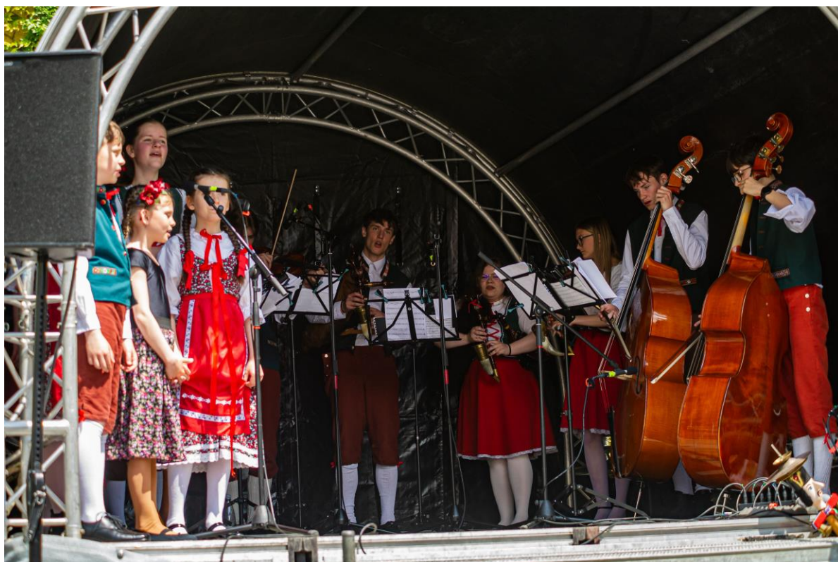
Dudácký soubor Schumák na Bavorsko- českých dnech přátelství v Selbu.