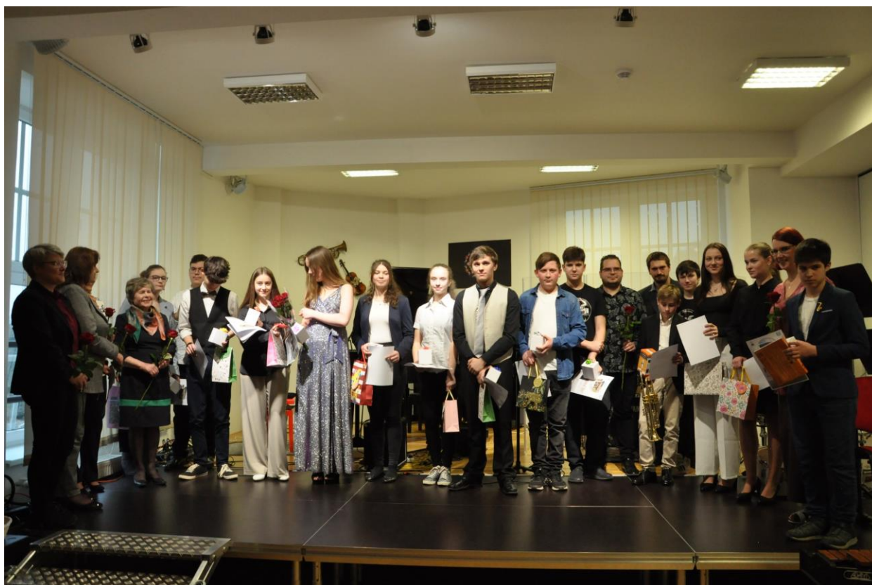
Absolventi I. a II. stupně hudebního oboru se svými učiteli a doprovázejícími spolužáky.