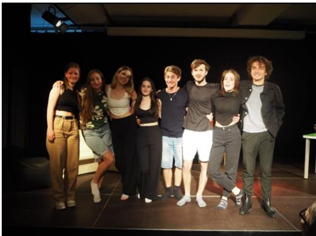
Divadelní soubor Six-pack postoupil do celostátního kola soutěže Mladá scéna v Ústí nad Orlicí.