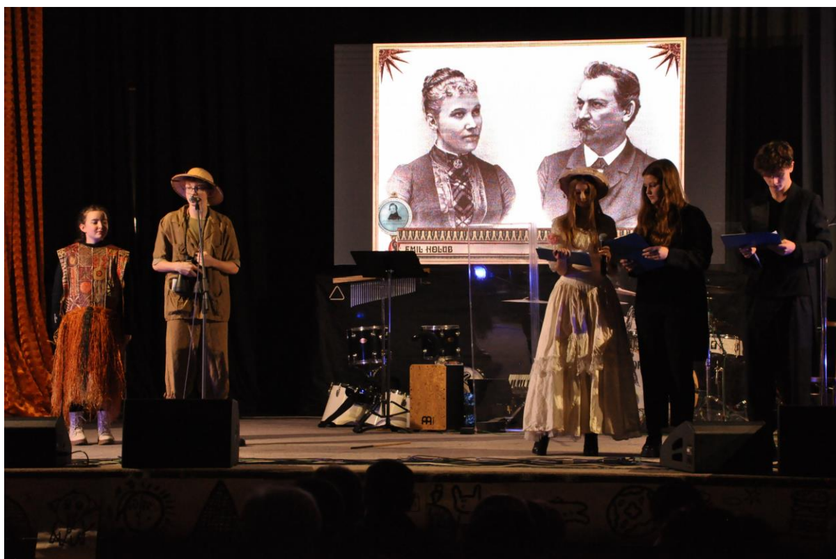
Divadelní soubor Rytíři a víly při uvádění celoškoliho projektu „Cesta kolem světa“.