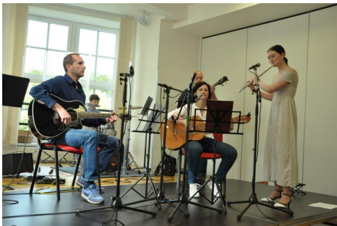
Rodina Polákových na Koncertu rodinném.